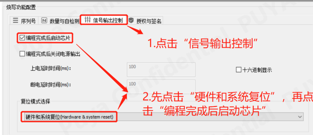
图 3-4 创芯工坊操作勾选“编程后重启芯片”