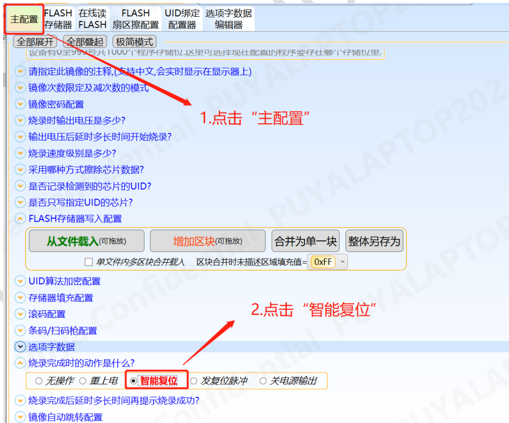
图 3-3 轩微操作 “智能复位”